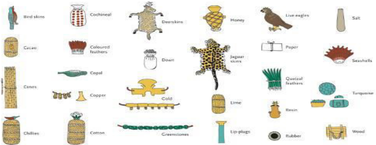
Cartographie des tributs fournis par les peuples voisins à l'Empire aztèque. ( http://www.britishmuseum.org/whats on/all current exhibitions/moctezuma )