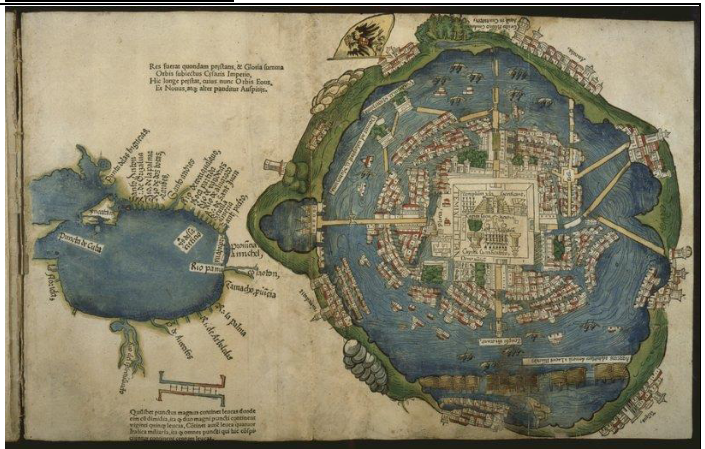
Plan de Tenochtitlan, publié en 1524 d'après la 2 ème lettre de Cortès à l'empereur Charles Quint, Nuremberg, Allemagne, imprim. Friedrich Peypus, 1524.