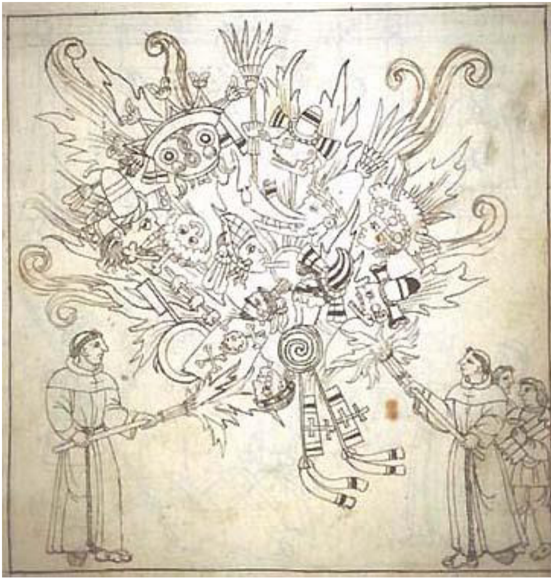
Violences iconoclastes et autodafés, illustration tirée de la Descripción de la ciudad y provincia de Tlaxcala écrite vers 1581-1584 par Diego Munoz Camargo, métisse, écrivain et interprète.